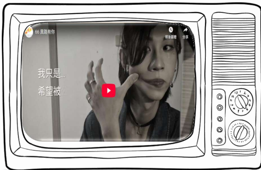
▶ 114年度性別多媒體徵選【銀獎】- 異路有你