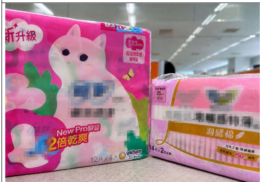
提供生理用品，供女性同仁生理期時使用