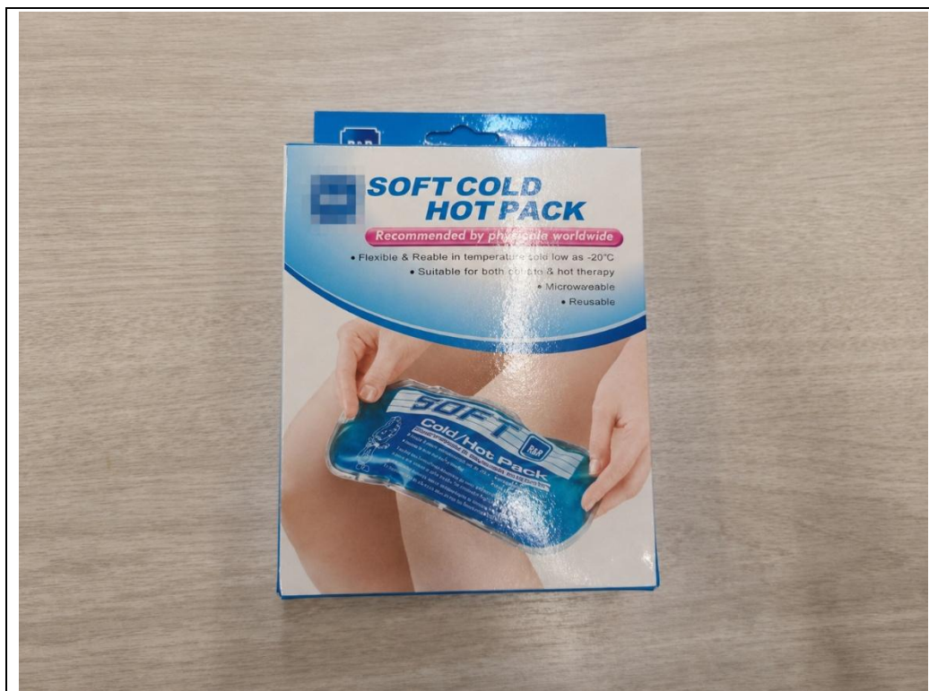
提供熱敷袋，供女性同仁生理期時使用